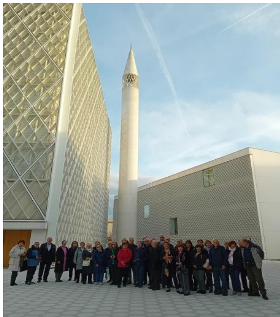
Udeleženci pred minaretom